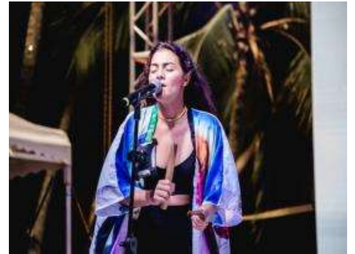
Presentación de Shonny y El hijo del Búho.