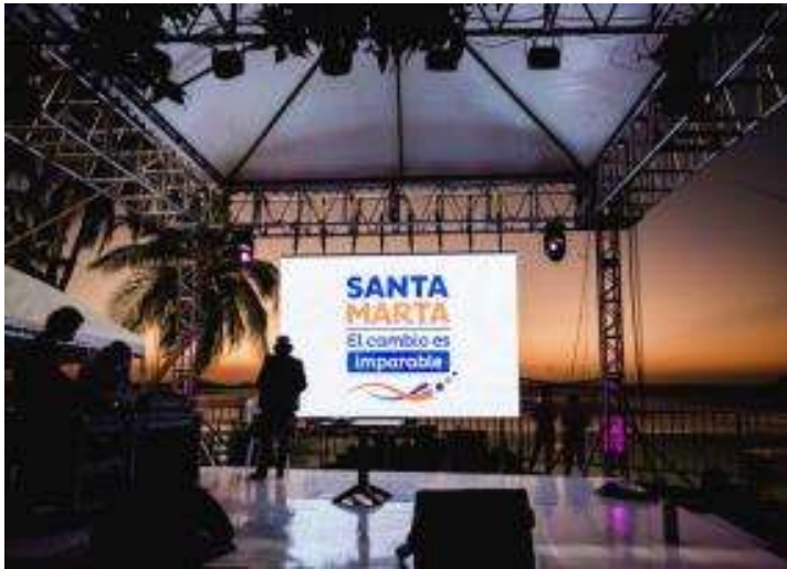
Presentación de El Mago HD