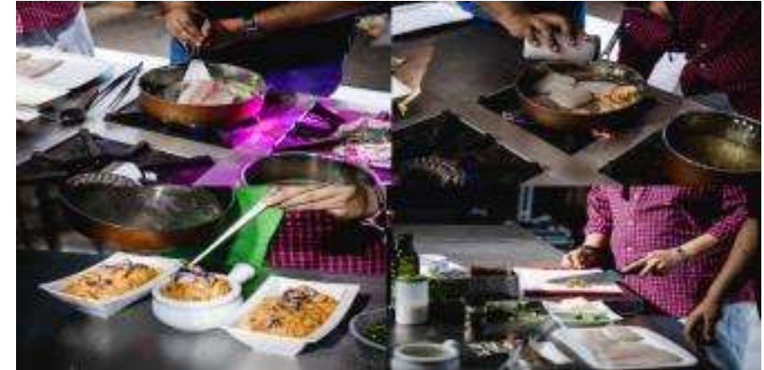
Show Cooking Iván Saumet y Calderito Foodie